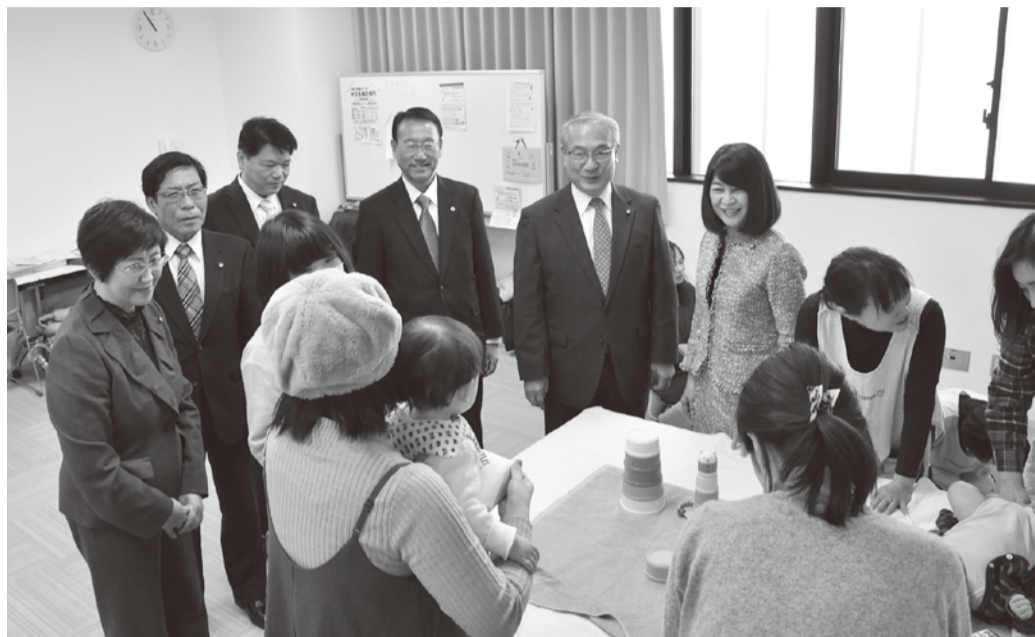
「あなたのまちの健康相談(通称:あなまち)」が行われている 龍華コミュニティーセンターを視察しました。

あなたのまちの健康相談(あなまち)とは、各出張所等の保健師が 赤ちゃんからお年寄りまで、すべての世代の方の健康に関する 様々な相談を聞かせていただく場です。