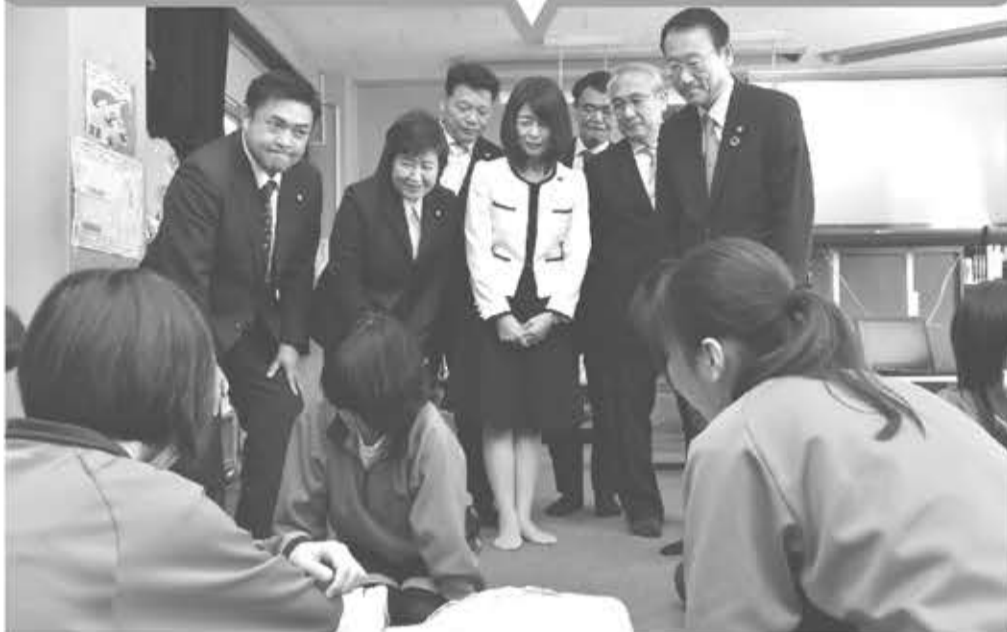
AED(自動体外式除細動器)を中学生が操作出来るようにする為、市内中学校で保健体育の授業に取り入れるという訴えが実現。 (令和元年度より実施)