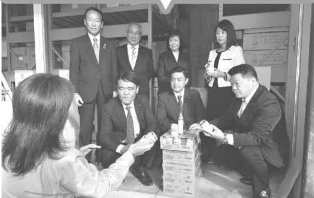
公明党の強い要望により、総合体育館内備蓄倉庫にスチール缶型の液体ミルク(240ml)が120本備蓄されました。